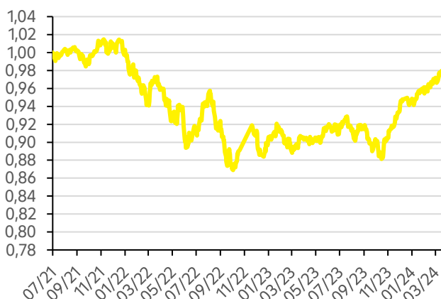
Vývoj hodnoty fondu FWR Strategy 30 EUR